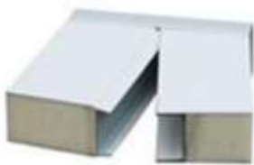
EPS Sandwich panels

Podemos montar casas de cualquier tamaño, diseño, acabados, de hormigón, pvc, madera, etc.